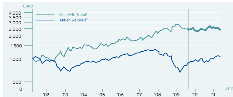
Jährliche Rendite 1

Die folgende Teilsimulation 1 zeigt das Performancepotenzial von Man AHL Trend (in EUR; Zeitraum: 01.04.2001 - 31.03.2011)